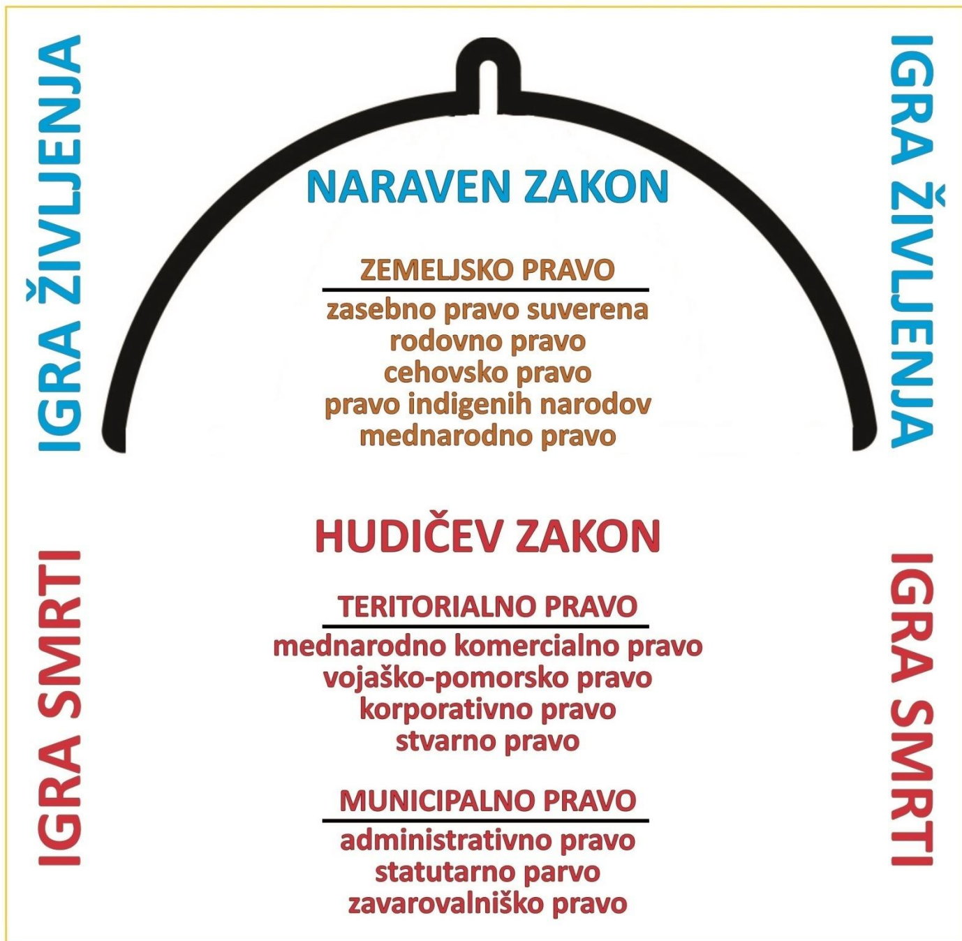
Slika 1: 4 igre - 4 jurisdikcije